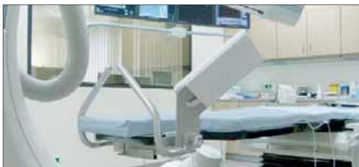
Das moderne Herzkatheterlabor

Alle Informationen zu den Fachabteilungen und Sprechzeiten finden Sie unter www.helios-kliniken.de/helmstedt